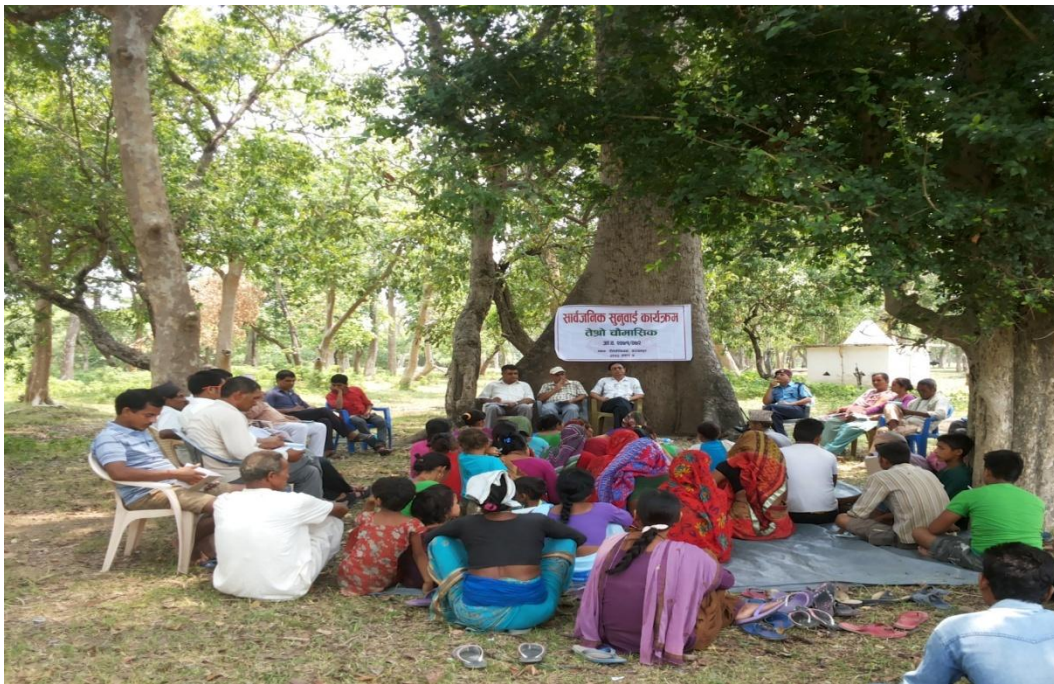
कार्यक्रमको एक दृष्य