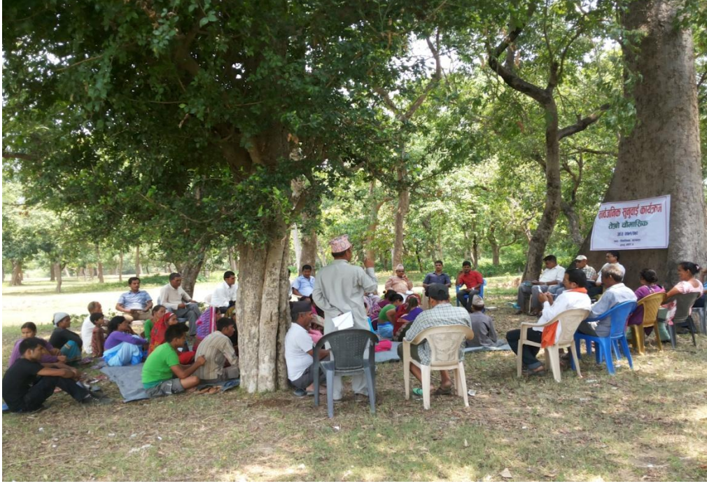
कार्यक्रममा सहभागी जिज्ञासा राख्दै