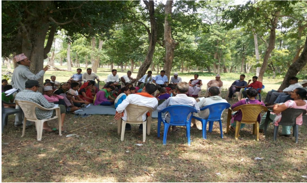
सहभागी आफ्नो जिज्ञासा राख्दै